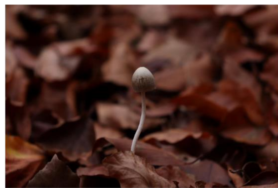
Fotografien zum Thema „Wald“, 2021, Luca Heide, Paula Sabel, Antonia Wergin