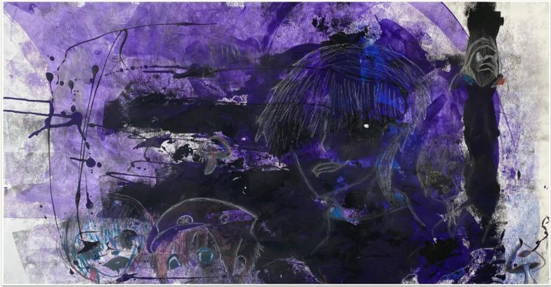
Druck & Grafik, 2021, Aline Kath